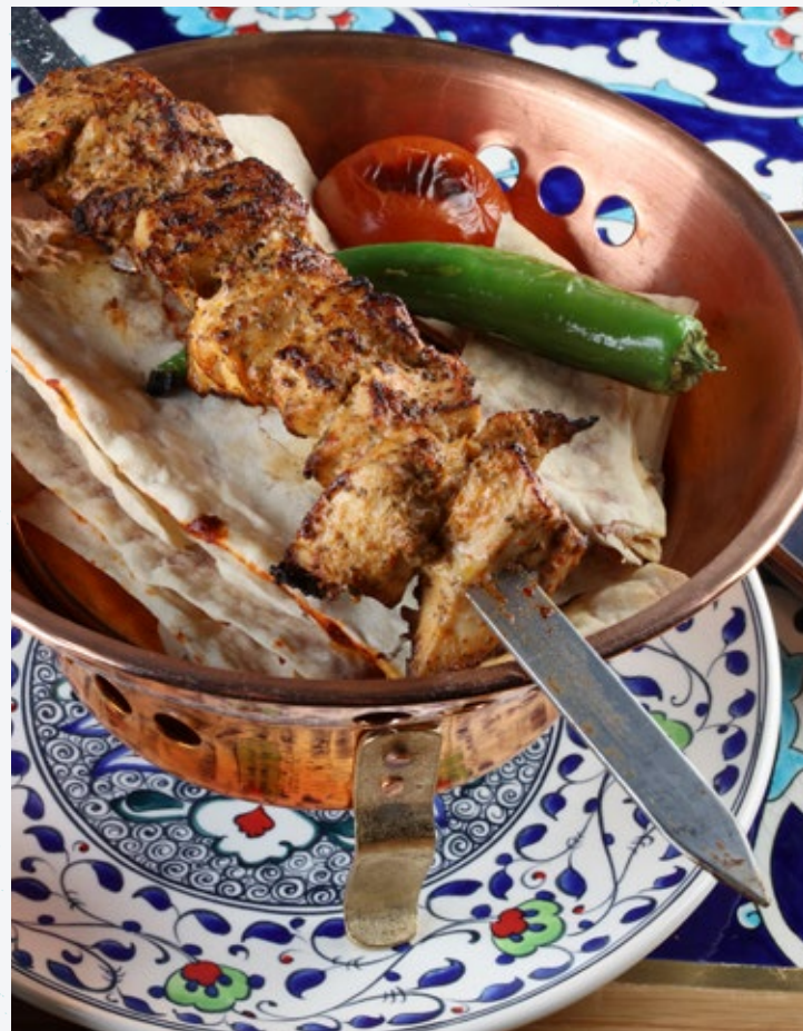
65 الدجاج المشوي Izgara Tavuk Şiş