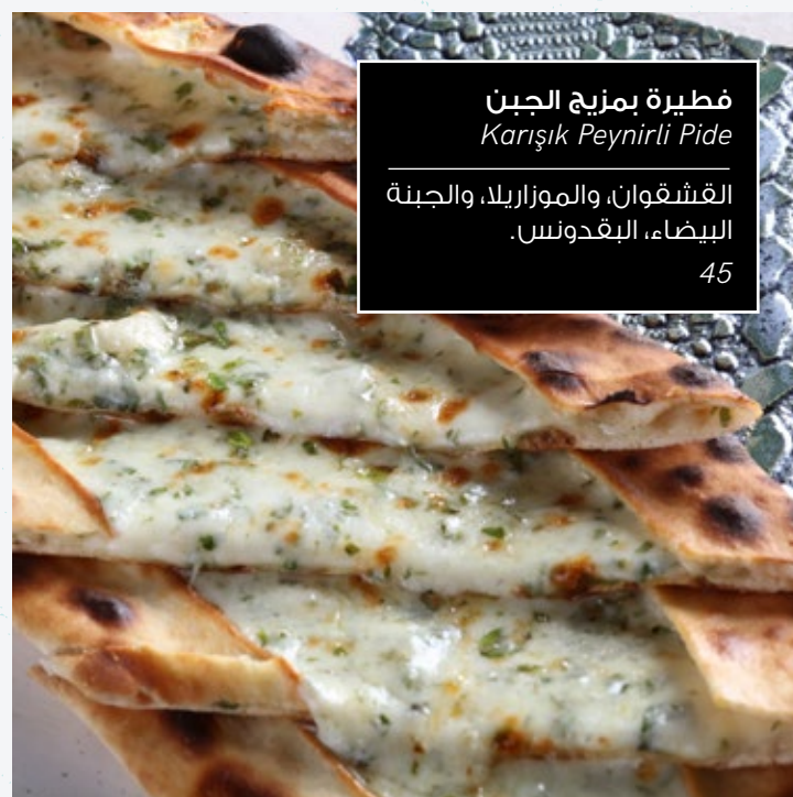
فطيرة بمزيج الجبن Karişik Peynirli Pide القشقوان، والموزاريللا، والجبنة البيضاء، البيقدونس. 45

الكوسة، والبنحورة، والبادنجان، والفلفل الأحمر، والجبن.