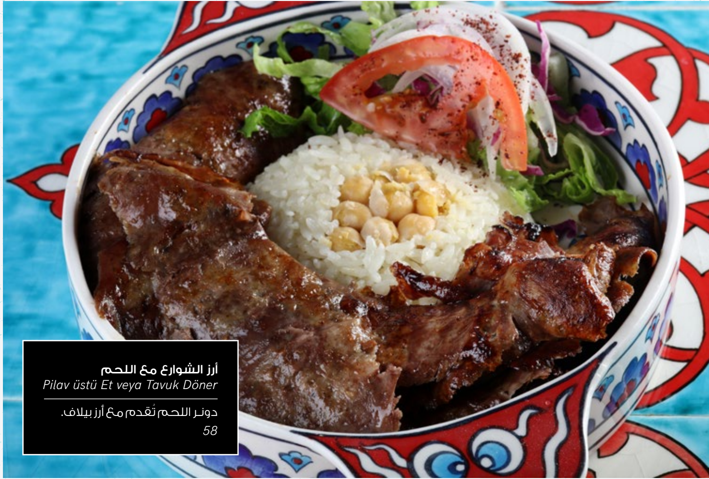
أرز الشوارع مع اللحم Pilav üstü Et veya Tavuk Döner دوئر اللحم تُقدم مع أرز بيلاف. 58

سمك طازج سوتيه وخضراوات ملفوفة بخبز اللافاش.