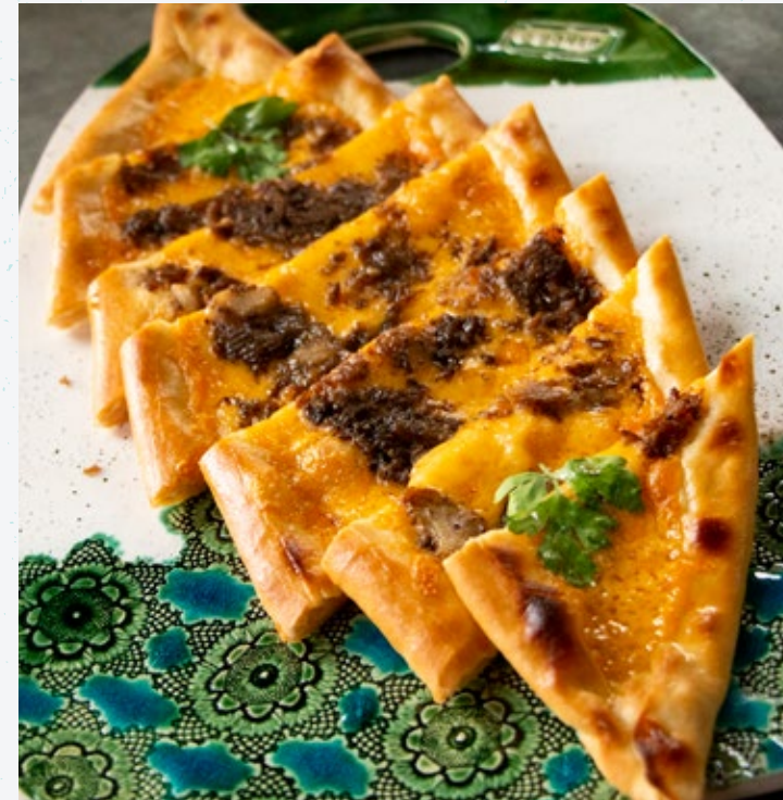
فطيرة اللحم البقري والجبن Kavurmali Çedar Peynirli Pide 45