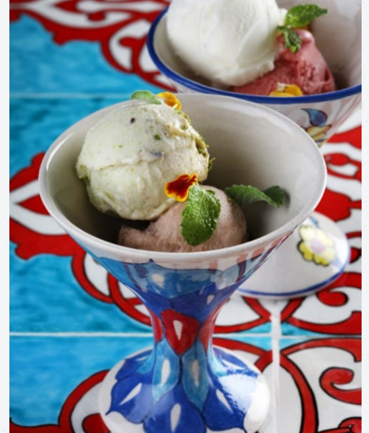
14 درهما لكل معرفة أيس كريم مرعش التركي Maras Dondurması أيس كريم تركي خاص من كهرمان مرعش.