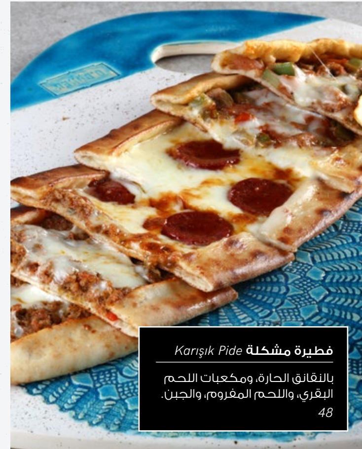
فطيرة مشكلة Karişik Pide 48

بالنقانق الحارة، ومكعبات اللحم البقري، واللحم المفروم، والجبن.