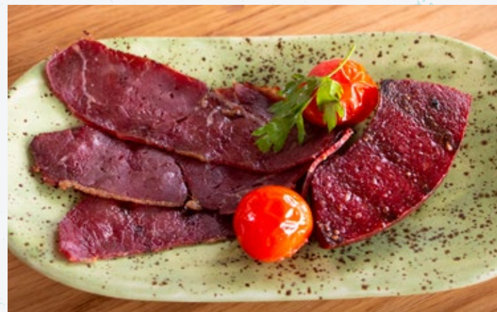
إفطار اللحوم Izgara Sucuk & Kayseri Pastirması

معجنات الفيلو المملوغة مع السبانخ السوتيه وجبن الماعز التركي.