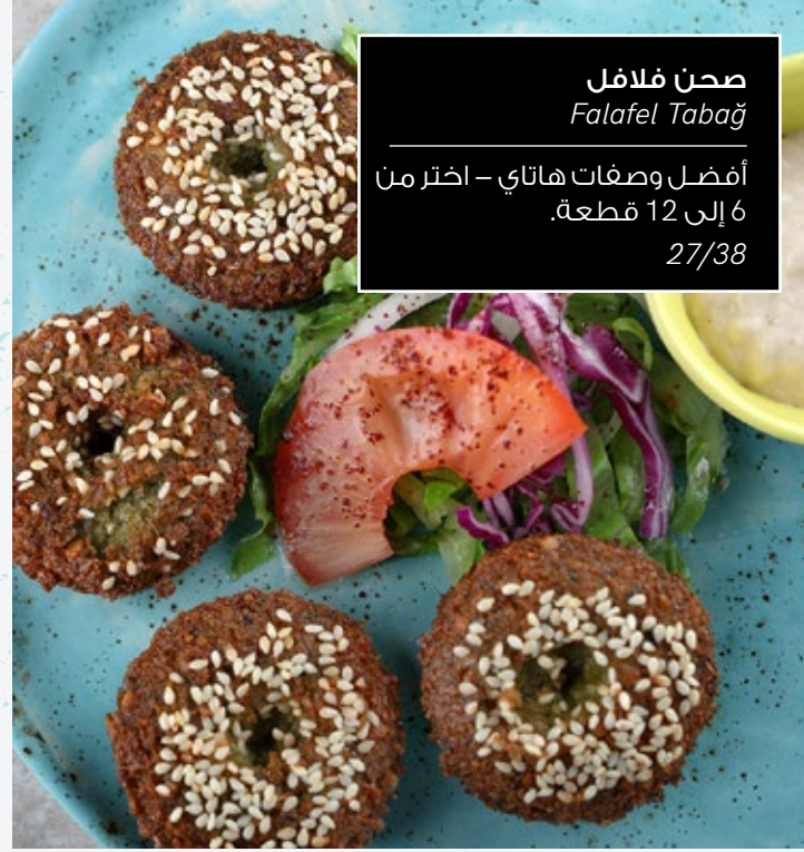
صحن فلافل Falaful Tabağı أفضل وصفات هاتاي - اختر من 6 إلى 12 قطعة. 27/38

38 ساندويتش الشوارع من تشيشمي Çeşme Kumrusu بالسلامي، والسجق، والنقانق، والجبن.