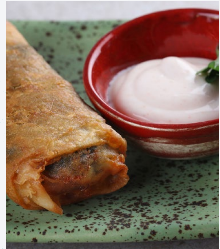
الفلفل مع عصوص الطحينة Tahin Soslu Falafel