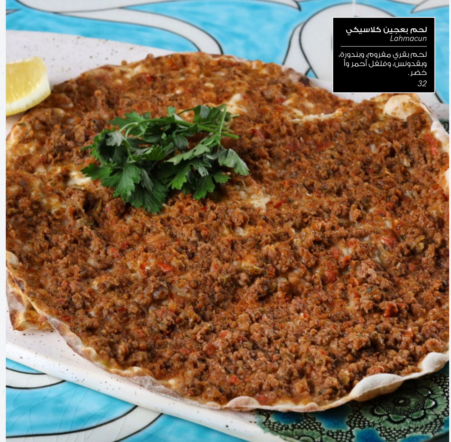
لحم بعجين كلاسيكي Lahmacun

من الشوارع المزدهمة للمدينة الأيقورية، غازي عنتاب