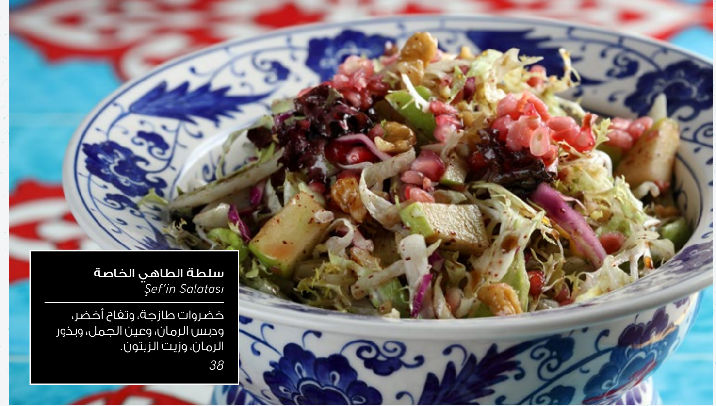
سلطة الطاهي الخاصة Şef'in Salatası

خيارات خالية من اللحم حافلة بالخضروات الطازجة من أراضي تركيا الخصبة