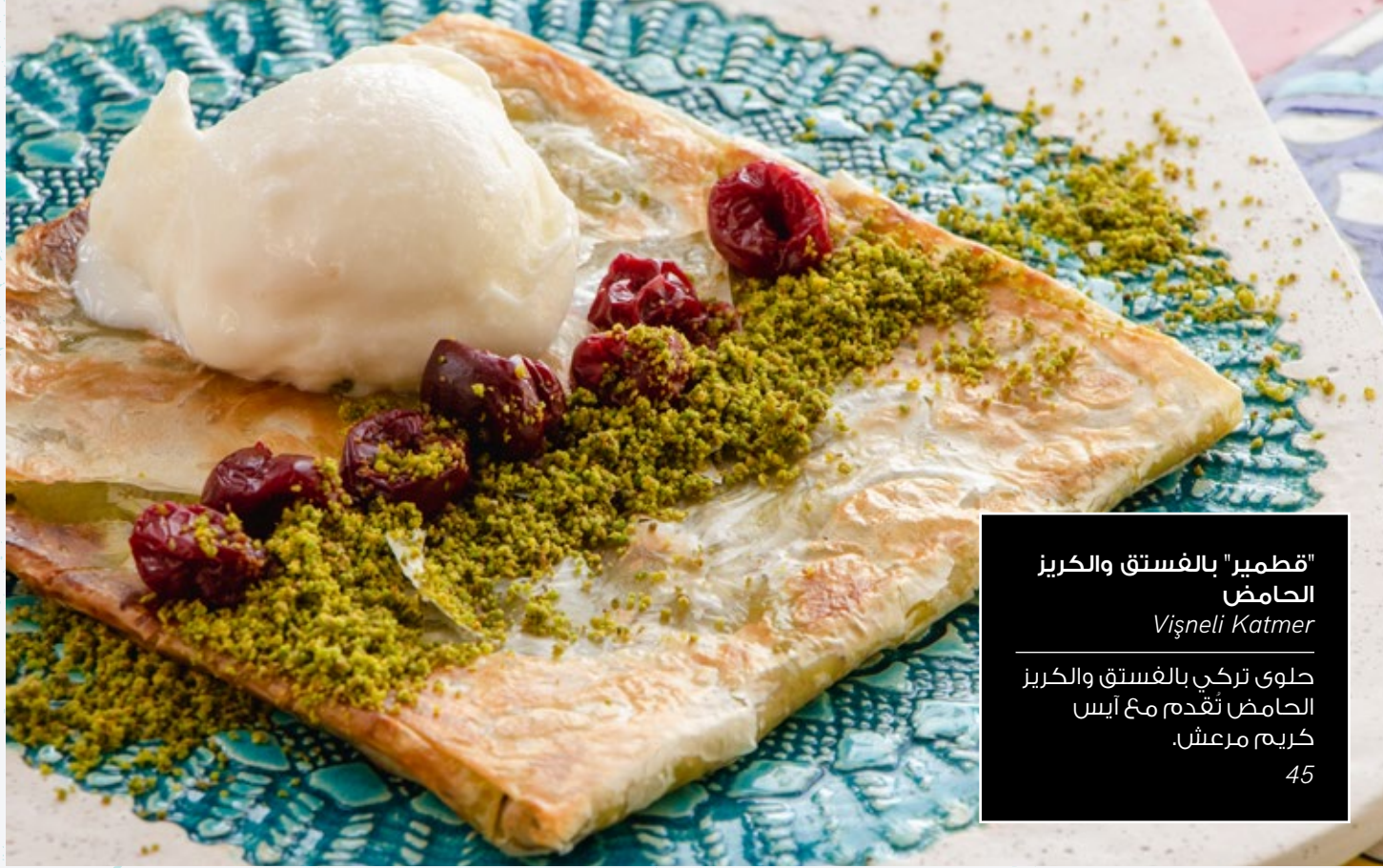
"قطمير" بالفستق والكريز الحامض Vişneli Katmer طوى تركي بالفستق والكريز الحامض تقدم مع آيس كريم مرعش. 45

حلويات أصلية مصنعة فقط من أفضل المكونات الطازجة في تركيا