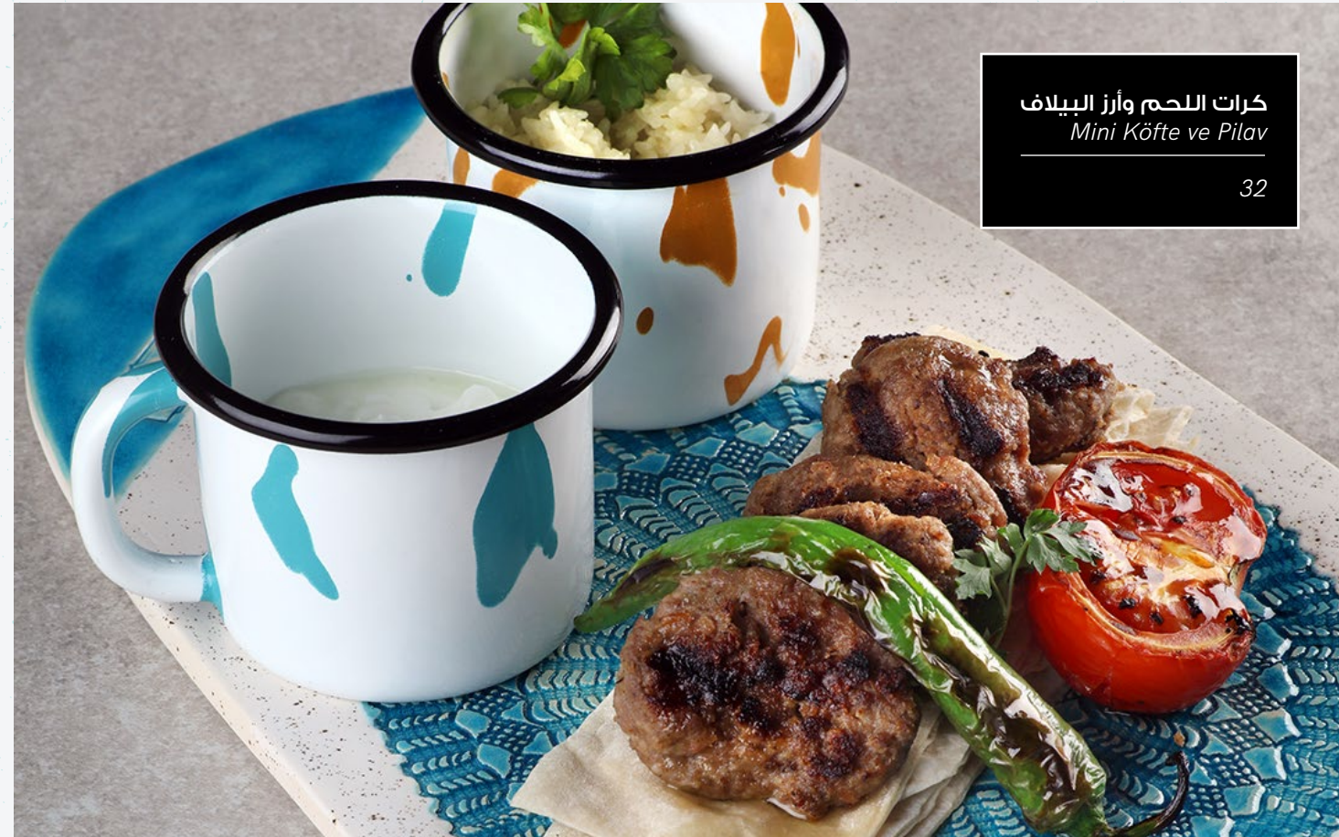
كرات اللحم وأرز البيلاف Mini Köfte ve Pilav