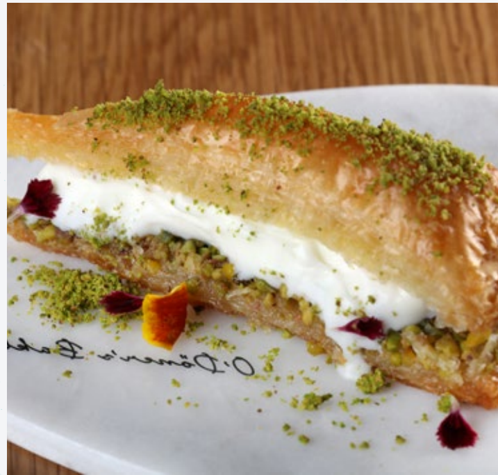
بقلاوة غازي عنتاب الأصلية Havuç Dilimi Baklava تقدم مع آيس كريم مرعش. 38