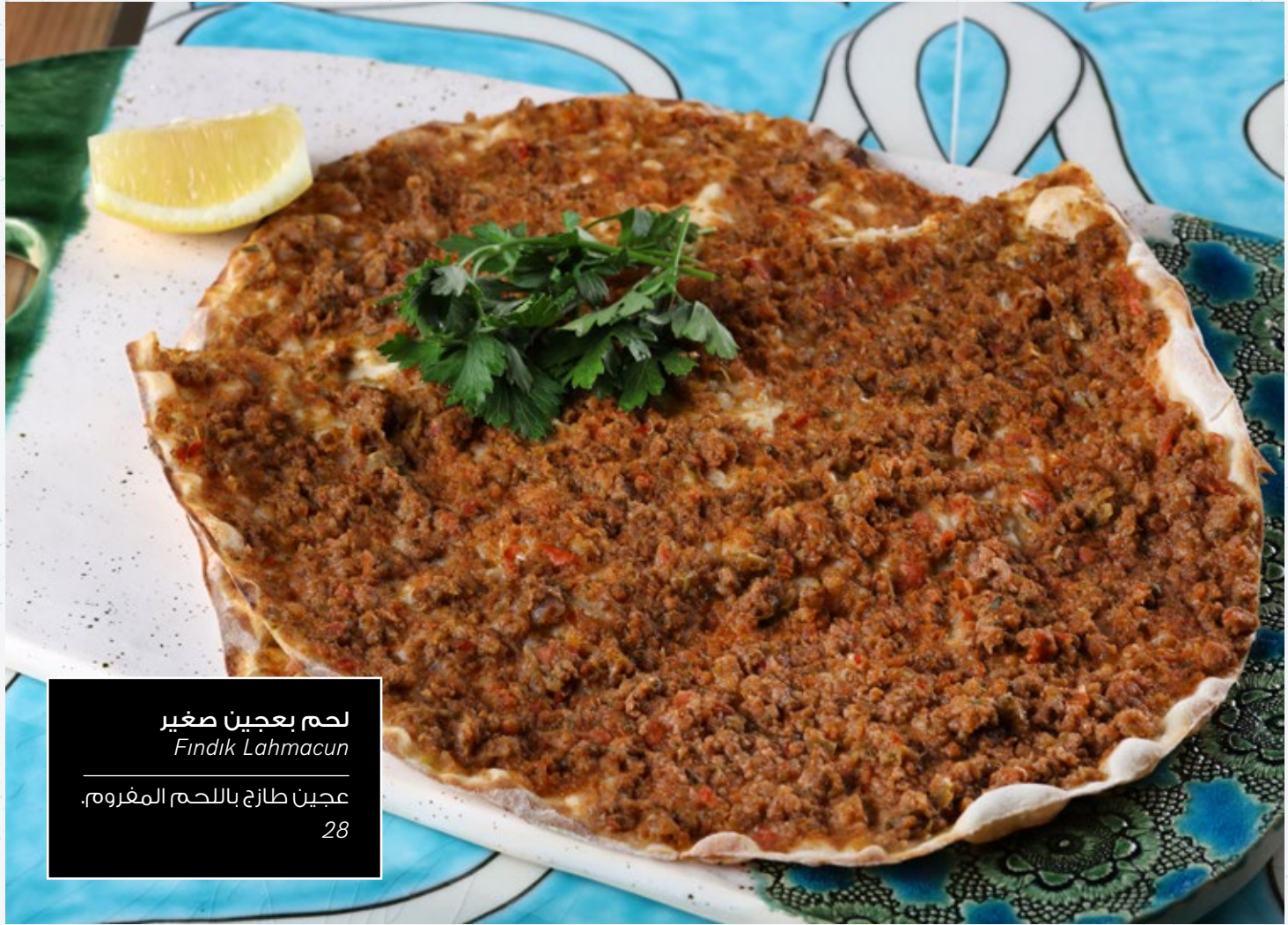
لحم بعجين صغير Findik Lahmacun عجين طازج باللحم المفروم. 28