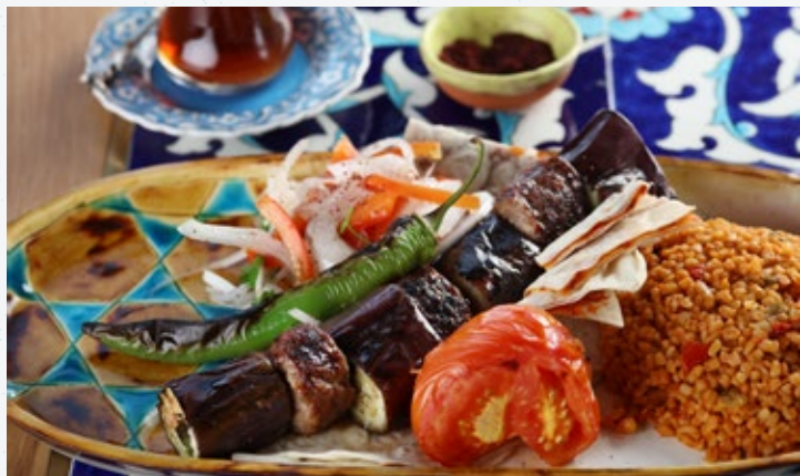
65 كباب بالخضراوات Sebzeli Kebab

لحم ضأن مشوي مخلوط مع الخضراوات المقدمة، وبيلاف البرغل والسلطة.