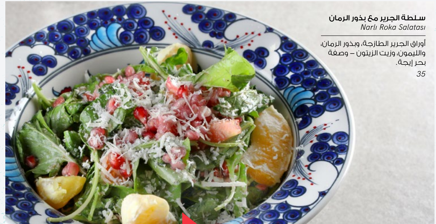
سلطة الجريز مع بذور الرمان Narlı Roka Salatası

أوراق الجريز الطازجة، وبذور الرمان، والليمون، وزيت الزيتون – وصفة بحر إيجة.