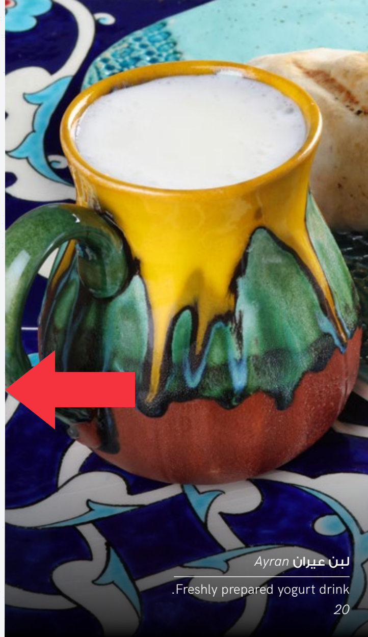
لبن عيران Ayran Freshly prepared yogurt drink 20