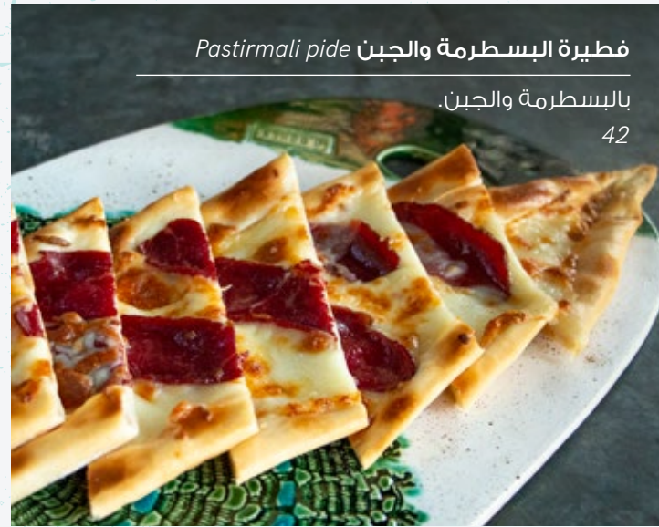
فطيرة البسطرمة والجبن Pastirmali pide بالجبن 42