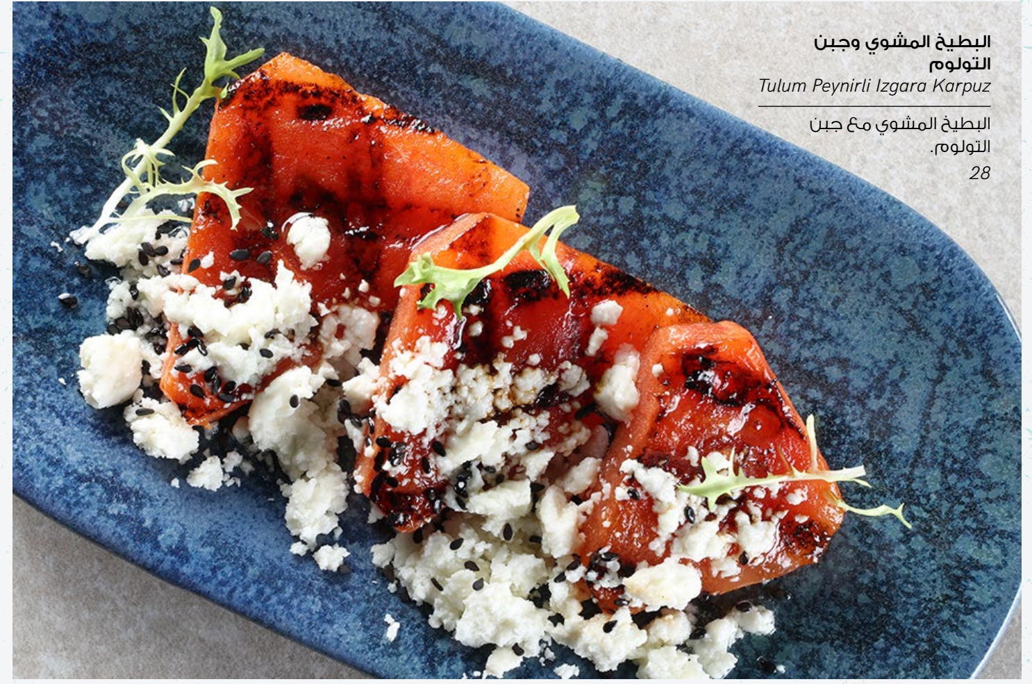
البطيخ المشوي وجبن التولوم Tulum Peynirli Izgara Karpuz البطيخ المشوي مع جبن التولوم. 28