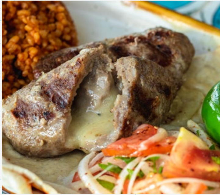
65 كرات اللحم بالجبن Kasarli Kofte

كرات لحم مشوية محشية بالجبن، وتقدم مع أرز البيلاف أو بيلاف البرغل وسلطة.