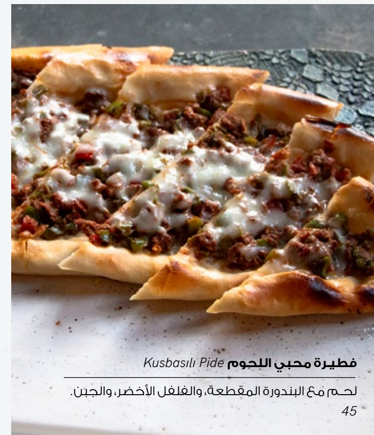
فطيرة محبي اللحم Kusbasılı Pide 45

لحم مع البندورة المقطعة، والفلفل الأخضر، والجبن.