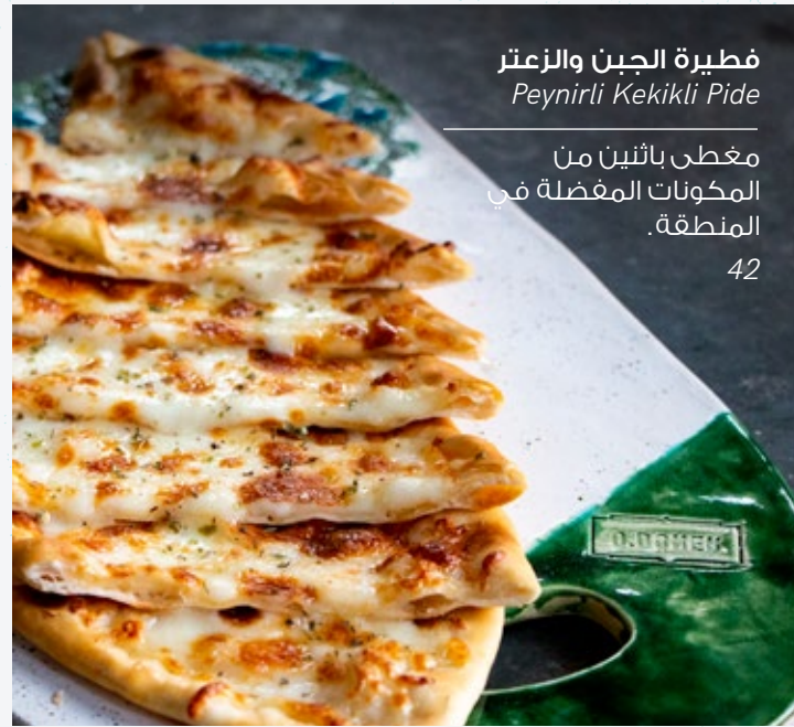
فطيرة الجبن والزعتر Peynirli Kekikli Pide مغطى باثنين من المكونات المفضلة في المنطقة. 42