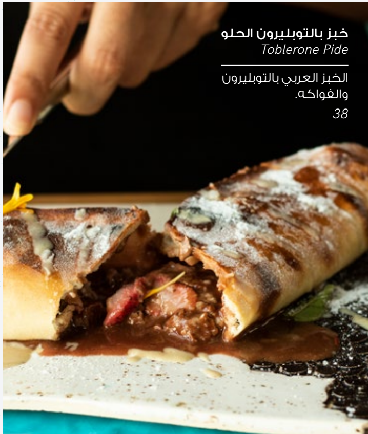
خبز بالتوبليون الحلو Tablerone Pide الخبز العربي بالتوبليون والفواكه. 38