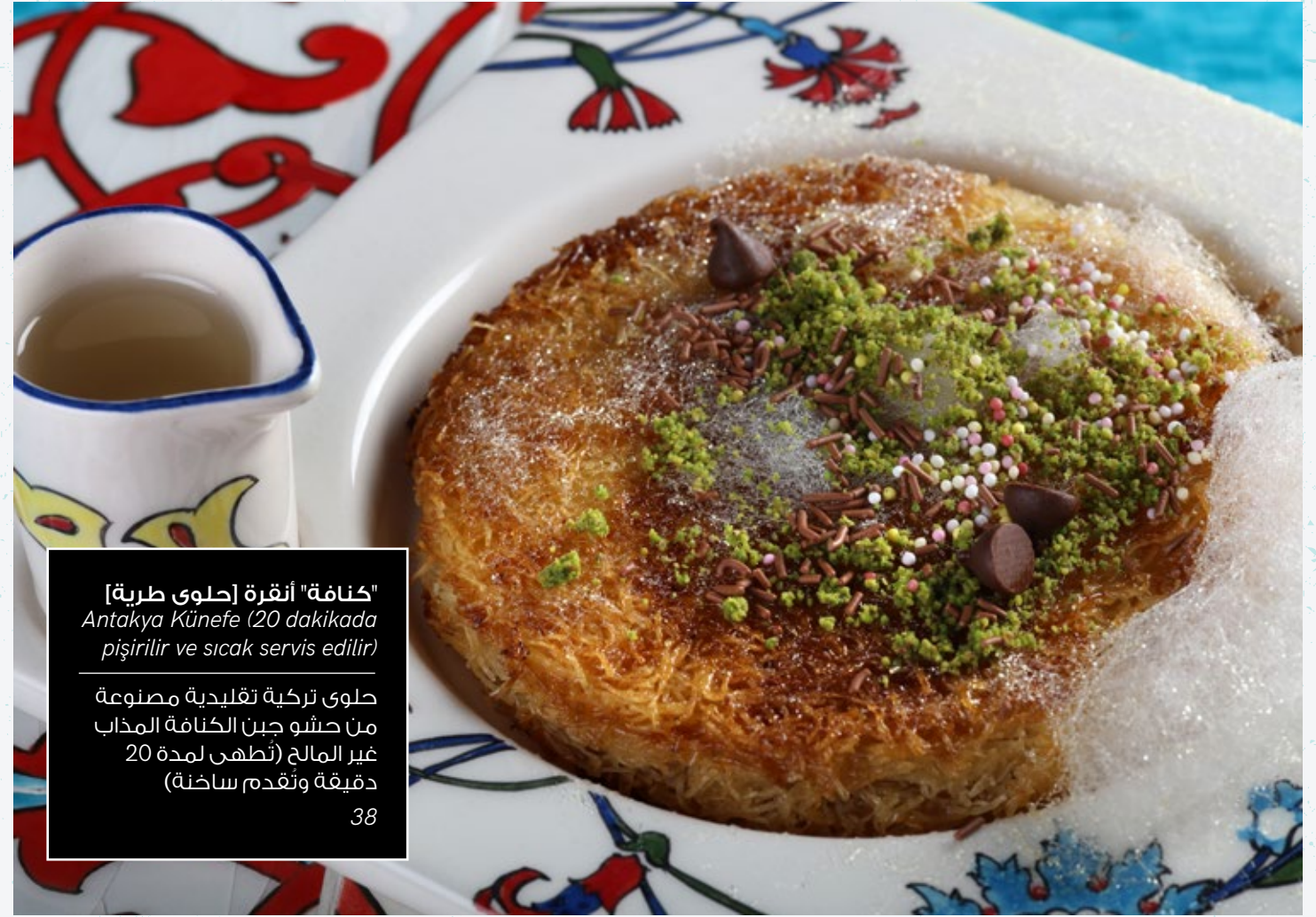
"كنامة" أنقرة [حلوى طرية] Antakya Künefe (20 dakikada pişirilir ve sıcak servis edilir) حلوى تركية تقليدية مصنوعة من حشو جبن الكنامة المذاب غير المالح (تطهى لمدة 20 دقيقة وتقدم ساخنة) 38