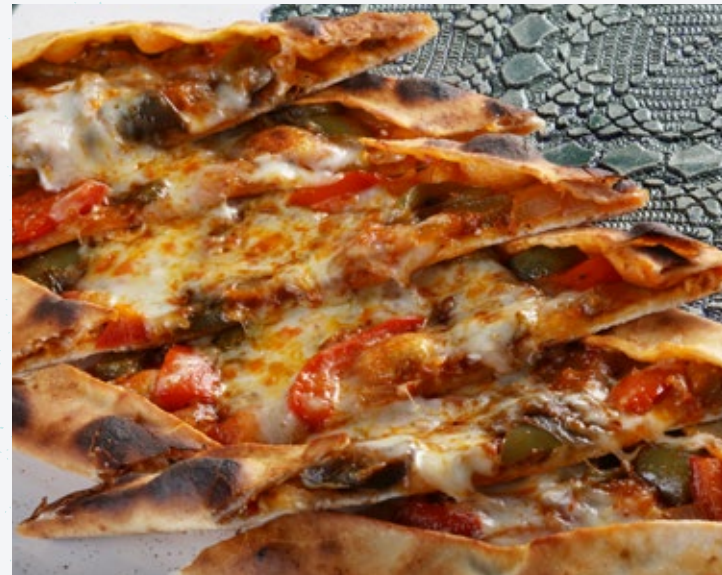
فطيرة الخضروات والجبن Sebzeli Peynirli Pide 45

اللحم المفروم، والفلفل الأخضر والأحمر، والبصل، والبيقدونس، والجبن.