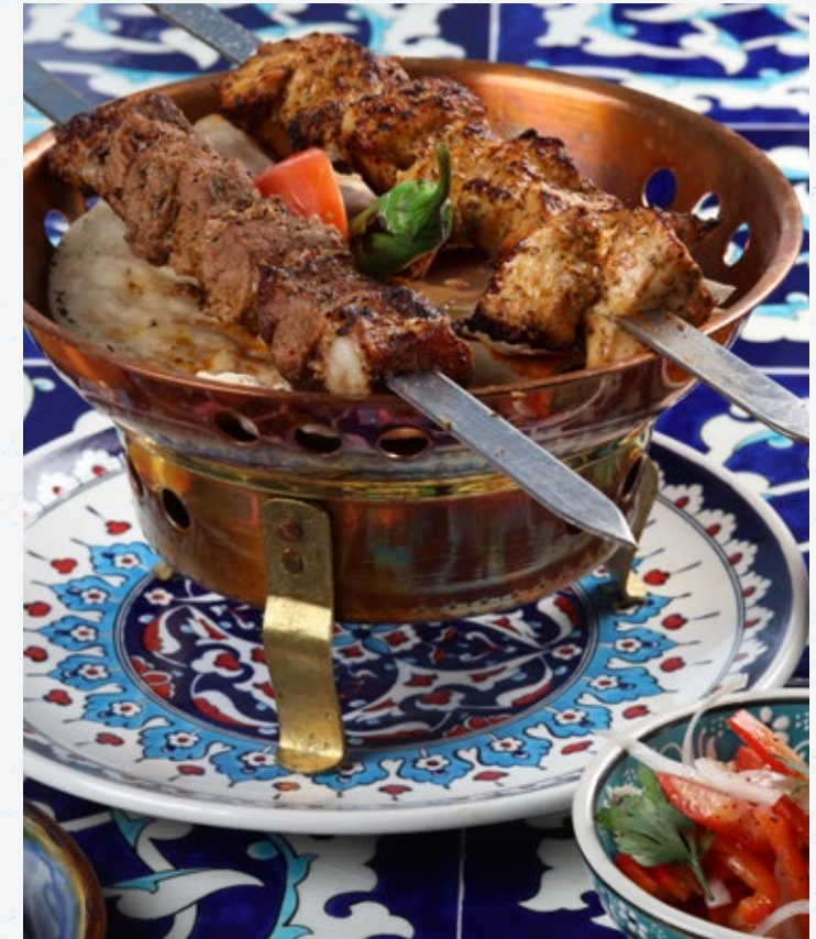
65 لحم الضأن المشوي Izgara Kuzu Şiş

مكعبات لحم الضأن المشوي مع أرز البيلاف والسلطة.