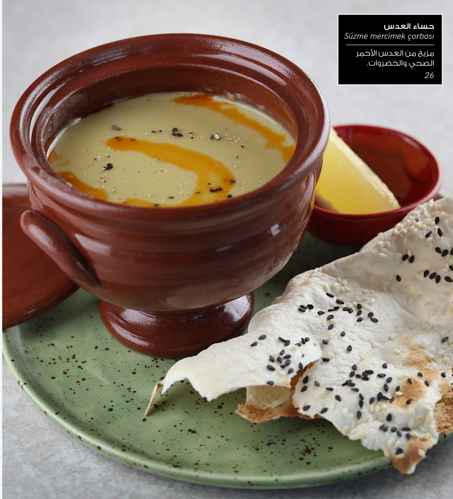
حساء العدس Süzme mercimek çorbasi

سلطانيات الخير التي تشتهيها النفس بلمسة عثمانية