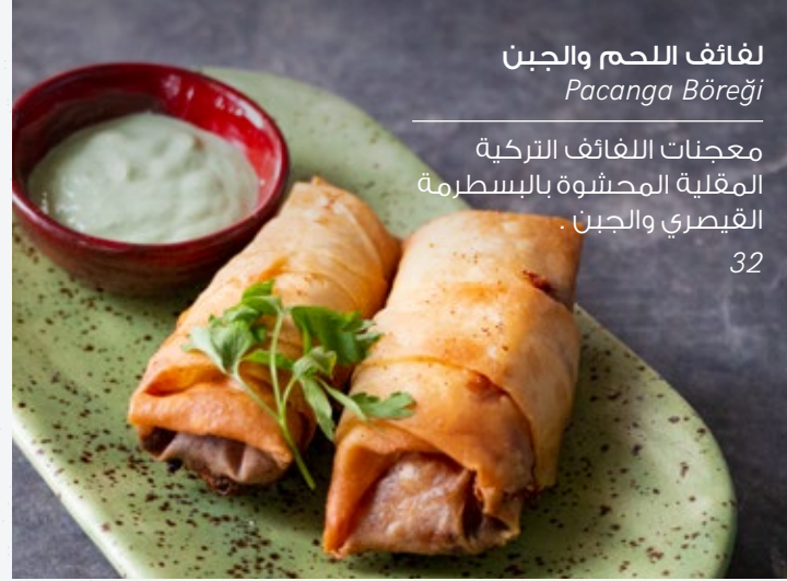
لفائف اللحم والجبن Pacanga Böreği

خبز مسطح تركي شهبي وتقليدي محشو بالبطاطا، واللحم المفروم أو الجبن، ويتم قفله وطهيه على صينية.