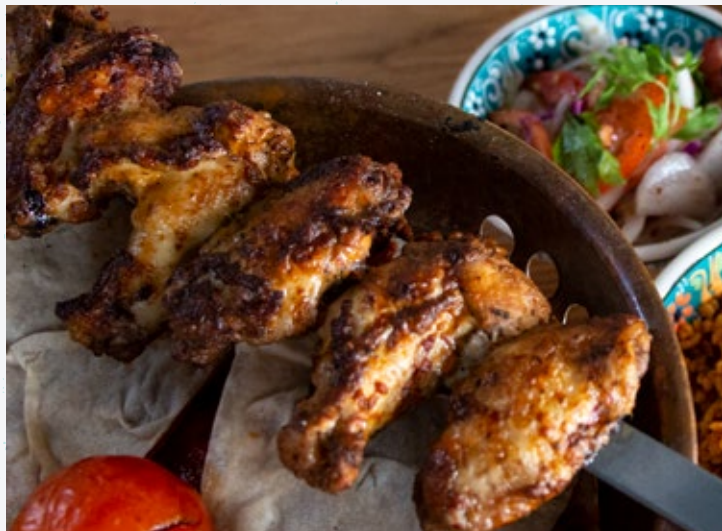
58 أجنحة دجاج مشوية Izgara Tavuk Kanat

كرات لحم مشوية محشية بالجبن، وتقدم مع أرز البيلاف أو بيلاف البرغل وسلطة.