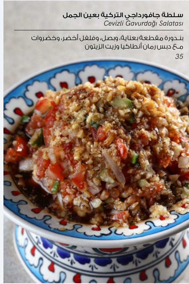
سلطة جافورداجي التركية بعين الجمل Cevizli Gavurdağı Salatası

بندورة مقطعة بعناية، وبصل، وبقدونس، وفلفل، وزيت الزيتون، وسماق من أورفة.