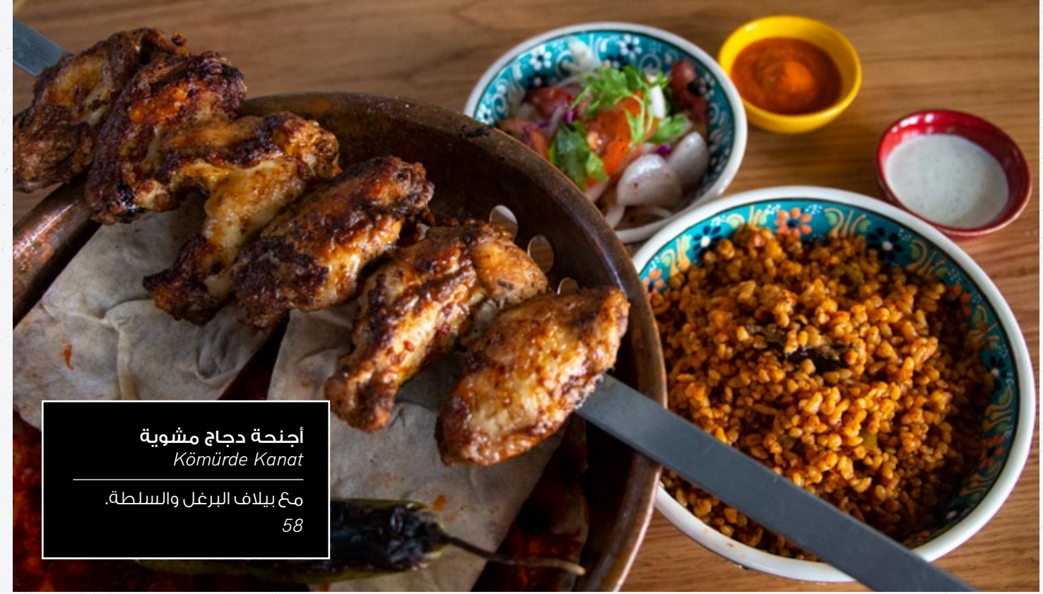
أجنحة دجاج مشوية Kömürde Kanat

لقد تجولنا في الشوارع المفعمة بالحياه لنجلب لك أفضل الأطباق التركية المحببة