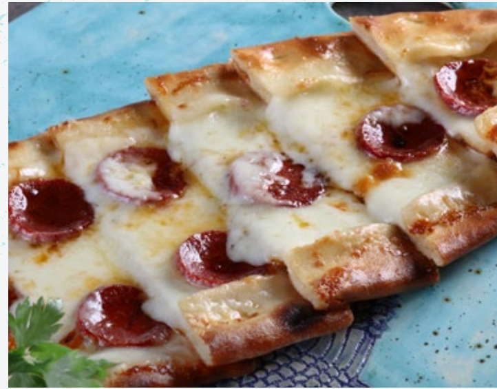
فطيرة السجق والجبن Sucuklu Kaşarlı Pide 45

نقانق من اللحم البقري التركي وجبن القشقوان.