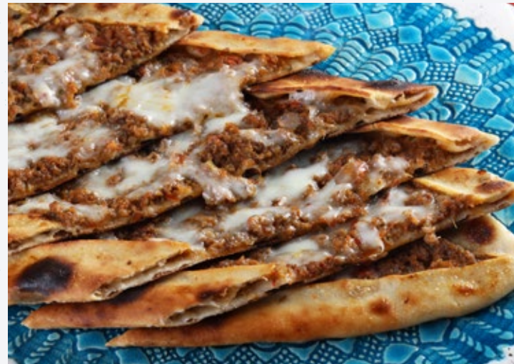
فطيرة اللحم المفروم والجبن Kiyma Kasar Pide 45

نقانق من اللحم البقري التركي وجبن القشقوان.