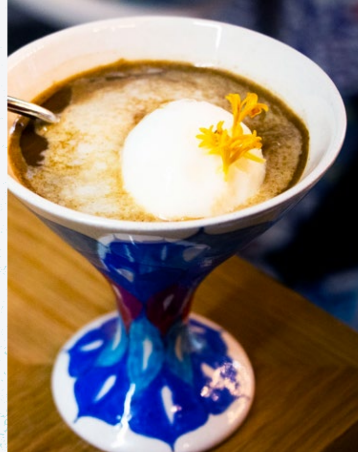
35 القهوة التركية بالاييس كريم والمستكة Damla Sakizi Dondurmali Turk Kahvesi