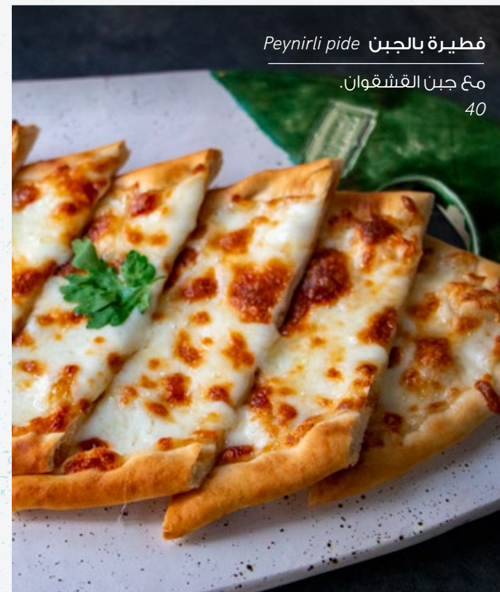
فطيرة بالجبن Peynirli pide مع جبن القشقوان. 40

بالنقانق الحارة، ومكعبات اللحم البقري، واللحم المفروم، والجبن.